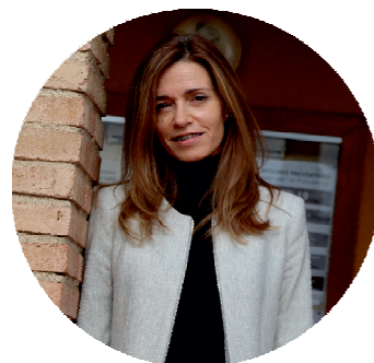
JÚLIA GIL Alcaldeessa d'Avinyonet de Puigventós

Des de l'Ajuntament seguim treballant per emprendre mesures que han de vetllar pel benestar i la qualitat de vida dels nostres vilatans i vilatanes, i restem a la vostra disposició per escoltar-vos i ajudar-vos en tot allò que, en la mesura del possible, puguem.